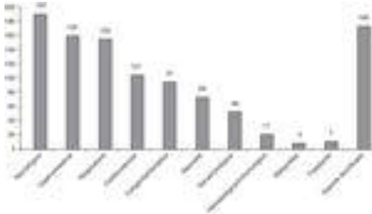
Figura 1. Número de pacientes con cada categoría de enfermedad crónica afecta y condiciones asociadas (N=243 pacientes).

El 92,59% de los pacientes (225/243) presentan pluripatología, definida como la presencia de 2 o más categorías de condiciones crónicas. La mediana del número de categorías de condiciones crónicas por paciente es 3, con un máximo de 7 categorías en 7 pacientes. Las condiciones crónicas más frecuentemente observadas han sido neurológicas, gastrointestinales y respiratorias (fig. 1). El 100% de los pacientes atendidos tienen 6 o más diagnósticos en el informe de alta de hospitalización o en el informe de la consulta.